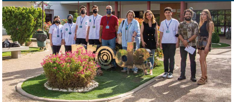
Alumnos/as y representantes de Europroyectos Erasmus Plus junto a representantes de Fundación PRODE