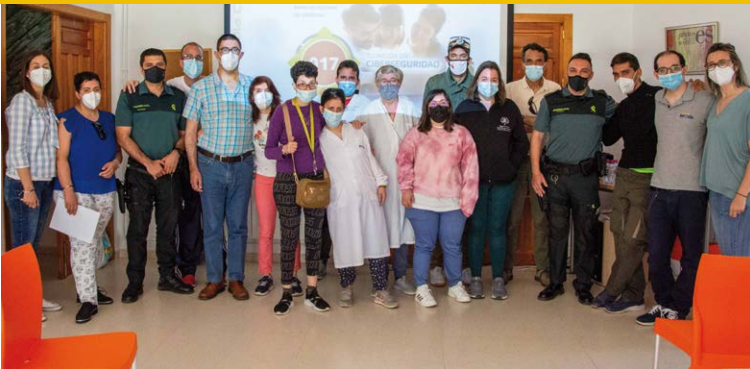
Finalización de la formación en seguridad digital a personas usuarias de Fundación PRODE