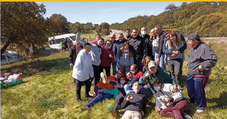
Usuarios/as de Fundación PRODE en sus salidas de ocio

Durante el mes de abril se han organizado, desde el Servicio de ocio de Fundación PRODE, actividades de diversa índole. En primer lugar, un grupo amplio de personas amantes de las competiciones automovilísticas asistió a la edición número 39 del Rallye Sierra Morena, en la que disfrutaron de una combinación perfecta de velocidad y emoción. Otras actividades a destacar han sido la visita guiada al Convento de Santa Clara de la Columna (Belalcázar) así como al Museo Etnológico (Hinojosa del Duque) donde en este último pudieron observar y conocer piezas en desuso y peligro de desaparición. También se han organizado actividades propiamente cofrades, como la asistencia al certamen de bandas y desfiles procesionales en los distintos pueblos del Guadiato y Los Pedroches. Por último, como broche final, la asistencia al concierto solidario de La Húngara "Dos Torres con Ucrania". En definitiva, un mes cargado de eventos y actividades para todos los gustos.