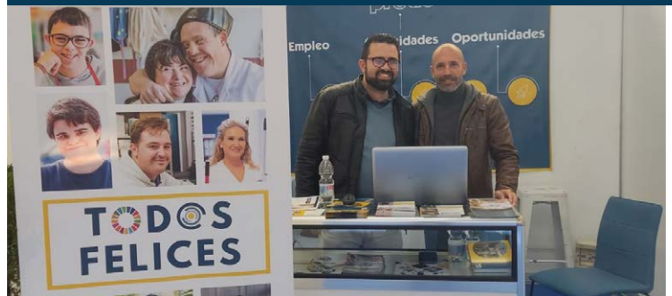
Técnicos de Capital humano de Fundación PRODE en el stand