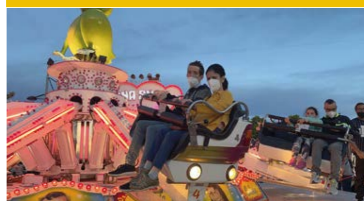
Personas usuarias disfrutando de las atracciones de feria

Durante el mes de mayo han sido varias las actividades que se han organizado desde el Servicio de ocio de Fundación PRODE. Entre ellas cabe destacar la diversión en las atracciones de feria con motivo de la festividad de San Gregorio Nacianceno en Pozoblanco, la llegada de la temporada de caracoles que permite disfrutar al grupo de amigos y amigas del ambiente veraniego de las terrazas, las rutas de senderismo en las que, además de practicar deporte, tienen la oportunidad de conocer lugares emblemáticos de la zona. A estas actividades hay que sumarle la celebración de la tradicional festividad de las cruces, en la que personas usuarias del Centro de día ocupacional, en compañía de monitores y monitoras expusieron las diferentes cruces realizadas en los talleres ocupacionales.