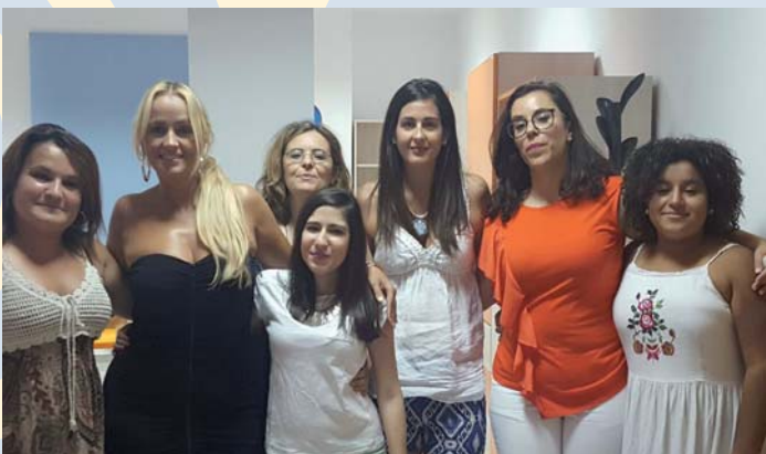
La Húngara en PRODE

Por otro lado, actividades como días de playa, piscina, las Olimpiadas rurales de Añora, ferias de la comarca, cines de verano, terrazas y conciertos hacen que la participación en la comunidad sea más activa. Y como actividad especial, cabe resaltar el concierto de La Húngara y la visita que la cantante realizó en PRODE a una usuaria que, por problemas de salud, no podía acudir a su concierto, acercándose a darle ánimos y fuerza.