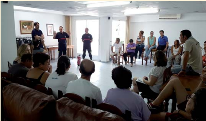
Un momento de la formación