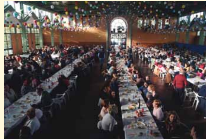
Trabajadores de PRODE durante la comida del Día de la Discapacidad en la Caseta Municipal de Pozoblanco.

Para PRODE, el Día internacional de las personas con discapacidad viene a ser la fecha en que todas las partes integrantes de la Organización, personas, familias, trabajadores, voluntarios y amigos en general, se unen, conviven y celebran el privilegio de trabajar por la misión que se han marcado como objetivo. En esta ocasión fue el 29 de noviembre el día elegido para su celebración, y no fueron pocas las actividades que se desarrollaron, en las que pudieron participar prácticamente todas las personas vinculadas al proyecto.