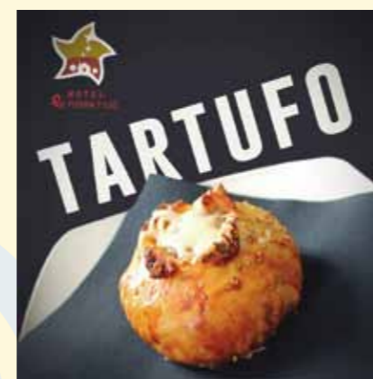
Una de las tapas que ofreció EH Piedra y Luz durante la Ruta de la Tapa.

El Hotel Rural EH Piedra y Luz, una de las iniciativas de PRODE destinadas a la creación de empleo para