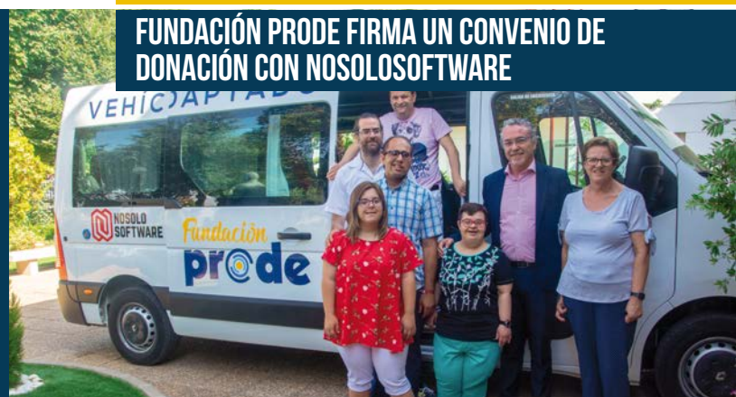
Pte. y usuarios Fundación PRODE junto al Pte. de NoSoloSoftware