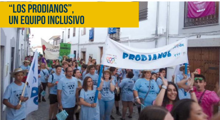
Equipo “Los Prodianos” en las Olimpiadas Rurales.

Durante el 5, 6 y 7 de julio tuvieron lugar las XII Olimpiadas Rurales en Añora. Un equipo de 20 personas, formado en su mayor parte por personas con discapacidad, representó a Fundación PRODE bajo el nombre de “Los Prodianos” siendo la segunda participación en un evento que se ha convertido en referencia dentro y fuera de la Comarca de Los Pedroches, con un nivel deportivo cada vez más alto. Gracias al esfuerzo y trabajo han logrado un gran resultado, ganando una plaza fija dentro de los mejores equipos de cara a próximas ediciones, demostrando así, que los límites están en la mente y que trabajando en equipo y con ilusión pueden enfrentarse a cualquier reto.