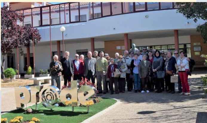
La Coral Marcos Redondo visita PRODE

El presidente de la Coral manifestó la sorpresa por lo que estaban viendo, animando a la Organización a seguir trabajando por la calidad de vida de las personas con discapacidad y sus familias, así como dar a conocer al resto de la población la labor desempeñada por PRODE.