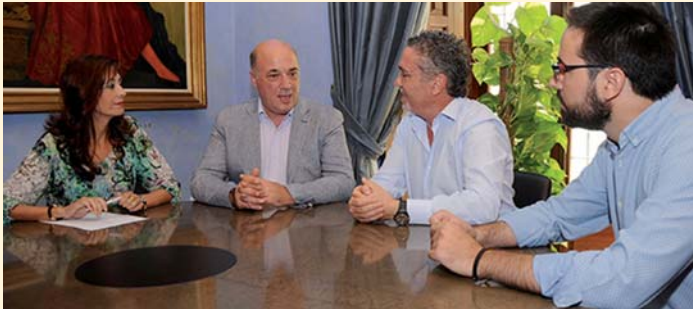
Firma del convenio en Diputación

En este mes, la Diputación de Córdoba ha renovado con PRODE su compromiso para fomentar la empleabilidad de las personas con discapacidad a través de la firma de un convenio de colaboración para desarrollar el Programa de apoyo a la inserción sociolaboral de personas con discapacidad y/o en situación de dependencia , apostando así por uno de los pilares más importantes de su Cartera de servicios: la creación de empleo.