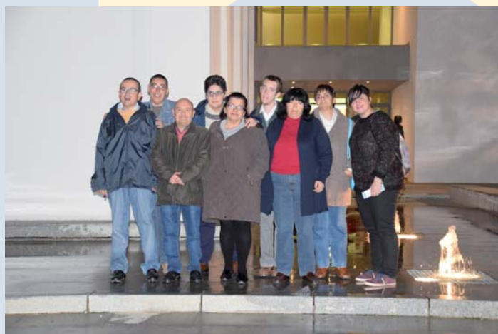
Usuarios de PRODE en la puerta de el teatro El Silo

Normalmente, en nuestra zona, el mes de noviembre se caracteriza por los primeros fríos, y comienza a apetecer quedarse más resguardado en casa al amparo del brasero. Sin embargo, esto no cala en la manera de ser de muchos usuarios de PRODE, los cuales allá donde hay un evento, allí participan. Comenzaron el mes asistiendo a la extraordinaria carrera por parejas de MountainBike de Añora (Bikend), donde se disfrutó de un estupendo ambiente deportivo, competitivo y sano. Más adelante, han participado en la genial iniciativa solidaria de VideSur y el IES Los Pedroches, que organizaron la I Marcha Solidaria "El sur también juega" donde 69 usuarios aportaron su granito de arena para el apoyo y desarrollo de Etiopía. Además de todo esto, pudieron disfrutar de la maravillosa experiencia que regala la música en directo, en el concierto de Santa Cecilia ofrecido por la Banda Sinfónica Municipal de Música de Pozoblanco. Finalmente, para culminar el mes, asistieron a la Ruta de la Tapa de Hinojosa del Duque que por si fuera poco, finalizó por parte de los clientes de PRODE en un gran perol en las instalaciones de la Unidad de Día con Terapia Ocupacional.