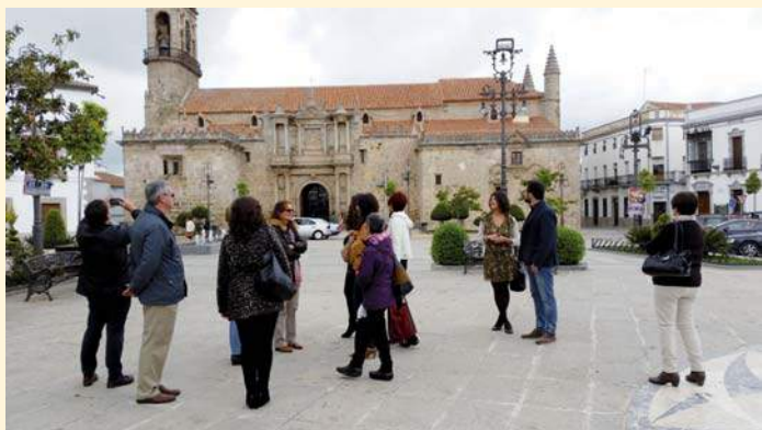
El foro andaluz de salud mental visitando Hinojosa

Para terminar sus actividades en el presente curso, el Foro Andaluz de Bienestar Mental, del que PRODE forma parte, organizó un día de convivencia entre sus miembros en Hinojosa del Duque. Además de suponer un punto de encuentro para comentar aspectos importantes para el Foro, se visitó la Catedral de la Sierra, varias ermitas y el museo etnológico, concluyendo con una visita y una comida en el Hotel Rural Piedra y Luz, establecimiento accesible para personas con discapacidad.