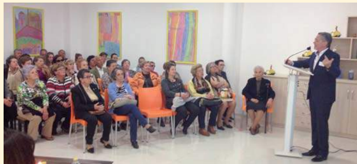
El Presidente de PRODE en un momento de su intervención

El pasado 22 de abril, la Unidad de estancia diurna para personas mayores "El Carmen" de Hinojosa del Duque fue el escenario de una jornada de puertas abiertas. La iniciativa sirvió para que decenas de personas conocieran de primera mano en qué consiste el servicio que PRODE presta en la localidad y plantearan sus necesidades y preguntas a través de mesas informativas. La jornada contó con la participación de la dirección del centro, la dirección del Área Social, el presidente de PRODE y el alcalde de la localidad.