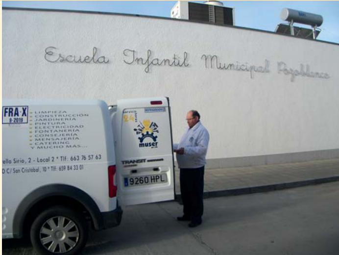
Muser PRODE suministrando el catering

El contrato, con un plazo de ejecución que abarca durante lo que resta del presente curso escolar y el próximo, tiene como objetivo atender las necesidades de preparación de comidas y su distribución a dicho centro, el cual tiene una capacidad máxima para 61 alumnos.