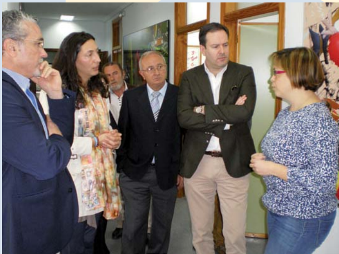
La directora de Atención Temprana explicando el servicio