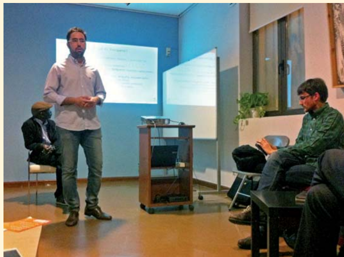
Presentación de “Yosíquesé” en el Córdoba Social Lab

El pasado 12 de noviembre tuvo lugar en Córdoba la presentación de “Yosíquesé” en el Córdoba Social Lab (CSL), foro promovido por la Fundación Cajasur donde se reúnen las entidades cordobesas socialmente más innovadoras. En él se describieron las líneas maestras de la iniciativa, destacando cómo la creatividad de las personas con discapacidad se pone al servicio de la creación de empleo.