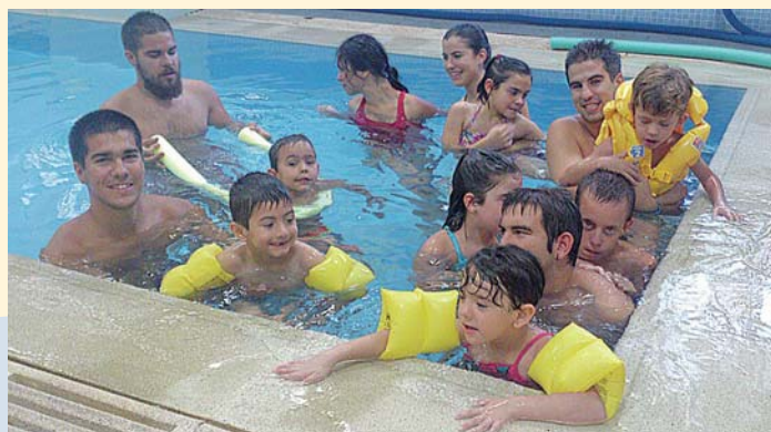
Escuela de verano eFusiva

Si la frase “Si no es divertido, no lo estás haciendo bien” es cierta, esta iniciativa ha sido un éxito, porque los asistentes lo han pasado genial, han cantado, bailado, reído..., en definitiva, se ha conseguido ofrecer experiencias enriquecedoras a todos los que han tenido la suerte de asistir.