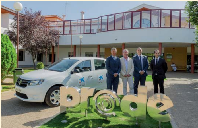
Presentación de la colaboración de la Obra Social de la Caixa

Iniciativas como esta llevan a la complicidad entre organizaciones empresariales y entidades sociales cuyo objeto es mejorar servicios que repercuten directamente en la calidad de vida de las personas con discapacidad.