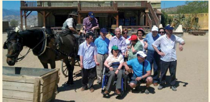
Vacaciones en un poblado del oeste, Almería

Además también se ha celebrado un día de convivencia de los usuarios, participando ciento noventa personas en el parque de San Martín, donde se pudo disfrutar de una magnífica jornada en la naturaleza, compartiéndolo con otros compañeros de la Entidad.