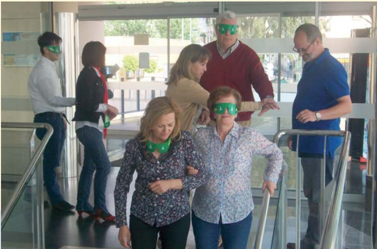
Una de las prácticas en las que participó PRODE

El uso de pictogramas y la lectura fácil han sido algunas de las propuestas de PRODE para hacer más accesible la información dirigida a las personas con discapacidad intelectual o del desarrollo.