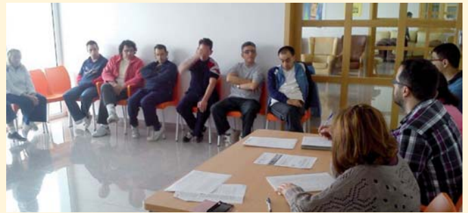
Asamblea de clientes

Desde principios del presente año, se vienen celebrando las distintas asambleas anuales de clientes en cada uno de los servicios asistenciales de PRODE, consolidándose éstas como un sistema libre de transmisión de ideas, demandas y sugerencias por parte de los usuarios.