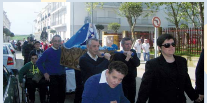
Procesión de "Ntra. Sra. María Stma. de la Paciencia"

Por otro lado, PRODE ha comenzado a elaborar el programa de vacaciones 2014 donde ya se conocen algunos destinos para descansar del trabajo realizado este año. Durante el mes de mayo viajarán a Mojácar (Almería), en el mes de junio disfrutarán de las ya tradicionales vacaciones en San Pedro del Pinatar (Murcia), y, por último, en Marbella (Málaga).