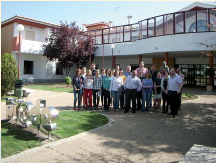
Responsables de centros, servicios y departamentos que han participado en el curso

Recientemente han finalizado dos cursos dirigidos a mejorar el capital humano de PRODE, en concreto la cualificación profesional de sus trabajadores. Por un lado, todos los responsables de centros, servicios y departamentos de la Organización (21 personas en total) han realizado un curso sobre técnicas de Coaching y liderazgo eficaz , adquiriendo innovadores conocimientos para la gestión de equipos de trabajo. Por otro lado, 12 trabajadores del área administrativa de PRODE se han formado en Navision , un nuevo y potente sistema informático para la gestión técnica y económica de la Entidad. Con ambos cursos culmina un primer trimestre cargado de acciones formativas para trabajadores.