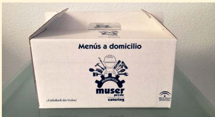
Envase en el que se transportan los menús

De este modo, será atendida la población de las zonas de Trabajo Social de Hinojosa del Duque, Peñarroya-Pueblonuevo, Pozoblanco y Villaviciosa de Córdoba, estimándose que PRODE desarrolle su actuación a favor de unos 5.000 beneficiarios.