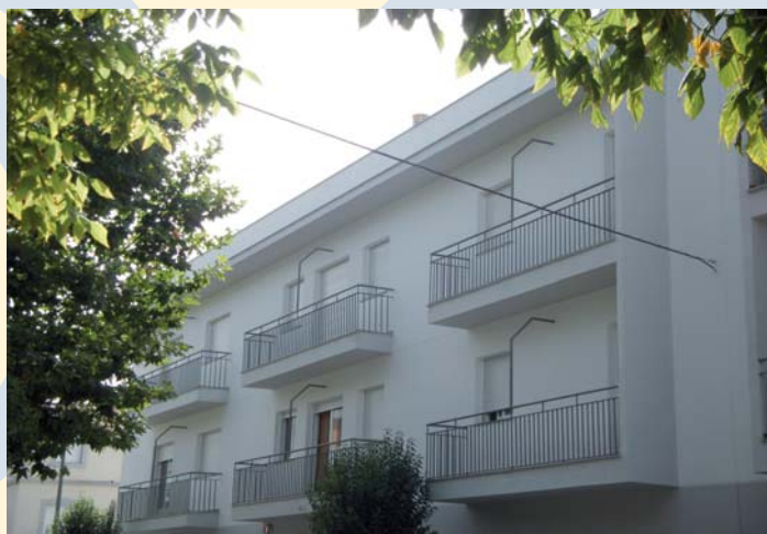
Edificio de VV.TT. que han obtenido la certificación de calidad

De cara a la obtención de la certificación en calidad por parte de la Agencia de Calidad Sanitaria de Andalucía (ACSA), el pasado mes de noviembre tuvo lugar la evaluación in situ de las Viviendas Tuteladas de PRODE por parte de un equipo de evaluadores de este organismo dependiente de la Consejería de Igualdad, Salud y Políticas Sociales. En esta visita se examinaron más de 100 estándares previstos en su Programa de Servicios Residenciales, muchos de ellos de cumplimiento obligatorio. El resultado de esta evaluación ha llegado a PRODE recientemente con el análisis de dichos estándares, informando de su nivel de cumplimiento y enfatizando en aquellos en los que es preciso mejorar. Haciendo efectivas estas mejoras, las Viviendas Tuteladas de PRODE se convertirán en el primer servicio de atención a personas con discapacidad en Andalucía en obtener esta certificación de calidad.