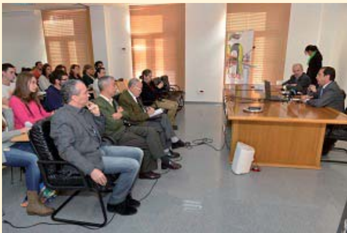
Jornadas de Otoño matinales celebradas en la sede de PRODE