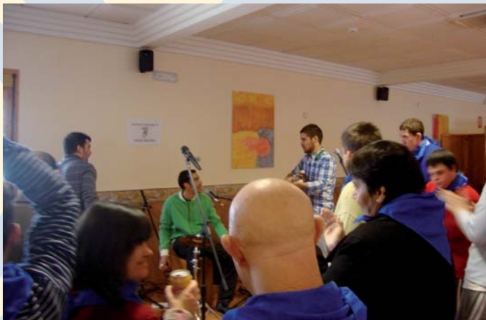
Fiesta en PRODE del Día Internacional de las Personas con Discapacidad

Por la tarde, destacaron animadas y divertidas actuaciones (teatrales, musicales, etc.) de los clientes de los diferentes servicios de la entidad. Por otro lado, tuvo lugar la entrega de la distinción "Amigo de PRODE" 2013, que fue entregado a la Fundación CajaSur.