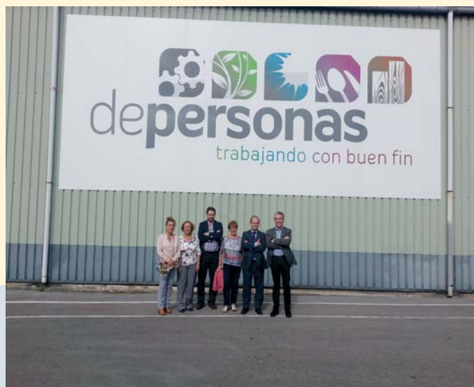
Presidente y Coordinador de Proyectos en una de sus visitas

El objetivo de la visita ha sido, por un lado, ofrecerles alianzas para la comercialización de vehículos eléctricos de la marca Electric City Motor, y por otro, conocer de cerca experiencias orientadas a afrontar la situación general de crisis que actualmente se vive.