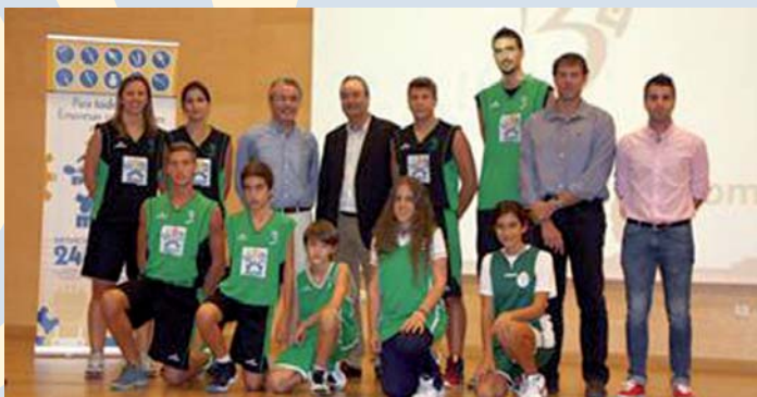
Equipo de Baloncesto Cordobasket