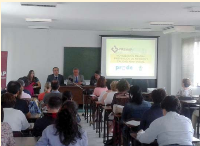
Trabajadores de PRODE en un curso de formación