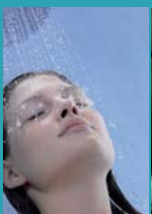
CICLO DE DUCHAS