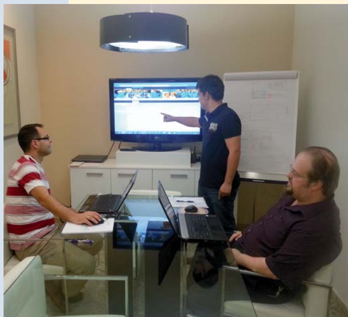
Trabajadores del Departamento de Sistemas en el Curso de Informática

Desde el pasado 13 de septiembre, una nueva acción formativa se halla en marcha para dotar a la Entidad de la máxima autosuficiencia respecto al uso de la herramienta informática Sharepoint . Los destinatarios de esta formación son los integrantes del Departamento de Sistemas de Información de PRODE que, durante un año, recibirán un total de 24 sesiones formativas presenciales en las instalaciones de la consultora Econlab en Córdoba. A través de esta herramienta se persigue la optimización y simplificación en la gestión de la información, permitiendo innovar, tomar mejores decisiones y, a la vez, retener el conocimiento de la Entidad. Por tanto, se busca incrementar la productividad de la empresa, ahorrar costes y mejorar la atención al cliente, obteniendo un impacto directo en el éxito de los servicios que se vienen prestando.