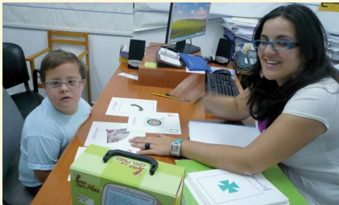
Usuario de Atención Temprana en una sesión de terapia

Por otro lado, a las familias se les prestará orientación y apoyo, gestión de ayudas y asesoramiento en el acceso a recursos sociales, educativos y sanitarios.