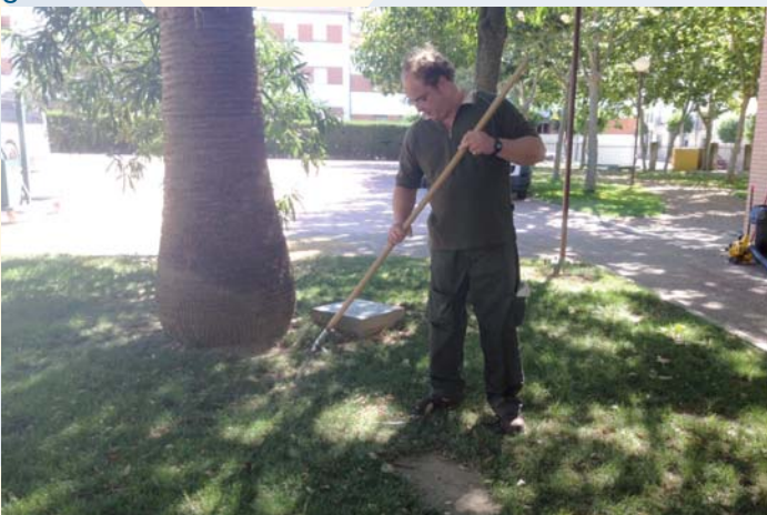
Uno de los trabajadores de jardinería

Con estos contratos, PRODE sigue apostando por el empleo, ya que serán 16 los puestos de trabajo estables para personas con discapacidad que serán cubiertos gracias a ellos.