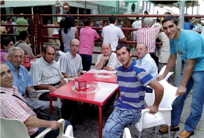
Salida a las fiestas de El Viso

Por otro lado, los usuarios de PRODE se desplazaron a Villanueva de Córdoba para participar en el multitudinario concierto organizado por la plataforma "Que pare el tren en Los Pedroches". El Servicio de Ocio de PRODE está trabajando por la total integración, normalización e inclusión de sus clientes en las diferentes acciones que la comunidad ofrece.