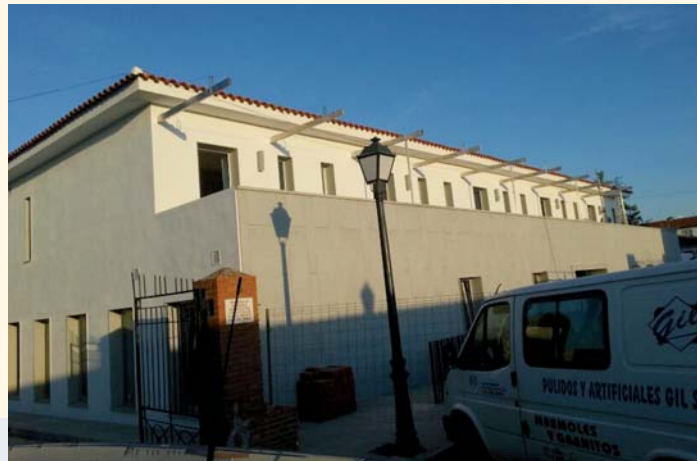
El hotel Piedra y Luz abre sus puertas el 23 de agosto

El próximo 23 de agosto, coincidiendo con el inicio de la Feria y Fiestas de San Agustín de Hinojosa del Duque, se inaugura el Hotel Rural con encanto "Piedra y Luz", de tres estrellas. Dicho día tendrá lugar un acto institucional y, posteriormente, el hotel quedará abierto a todos los que quieran disfrutar de su restaurante, terraza, spa, sala de convenciones o cualquiera de sus 13 habitaciones, con instalaciones adaptadas y accesibles a personas con discapacidad.