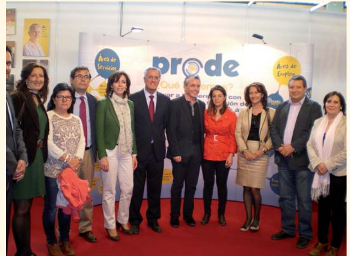
Estands de PRODE en la Feria Agroganadera

La Entidad, en la búsqueda de nuevos yacimientos de empleo, han incorporado dos nuevas actividades: Muser PRODE , empresa multiservicios con cobertura en toda la provincia, y Electric City Motor , dedicada a la venta de vehículos eléctricos, presentado una gran variedad de sillas de ruedas, scooters, ciclomotores y triciclo para movilidad reducida, así como bicicletas y un vehículo para labores agrícolas y cinegéticas. Estos últimos han sido una atracción significativa en la feria, siendo uno de los stands más visitados.