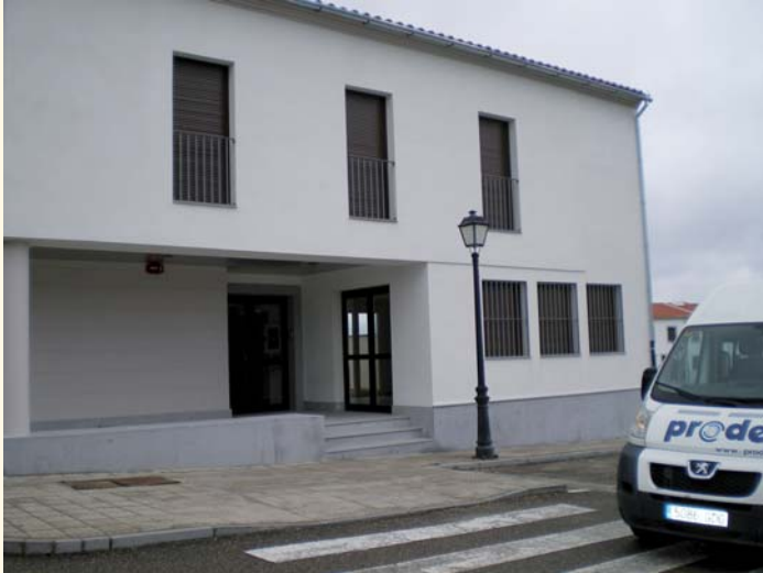
Unidad de Estancia Diurna de Mayores de Dos Torres

De los diferentes proyectos que se vienen realizando desde PRODE, la construcción de las Unidades de estancia diurna para personas mayores de Hinojosa del Duque y de Dos Torres ha llegado a su término. Tras este paso dado, queda pendiente el equipamiento de ambos centros, que se realizará de inmediato, así como la tramitación de las pertinentes autorizaciones administrativas, requisito previo para su posterior apertura.