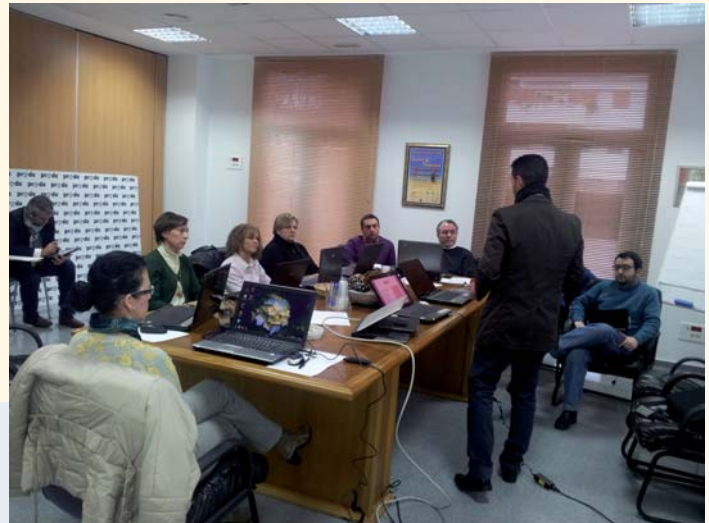
Curso de formación en Dirección

En este mes se ha desarrollado una acción formativa para el Consejo de Dirección y algunos puestos de responsabilidad de PRODE orientada a la comunicación externa y el liderazgo. Las empresas Econlab y MCS han impartido, en un par de jornadas, acciones innovadoras sobre internet 3.0 y técnicas de alta dirección del deporte aplicadas a la empresa.