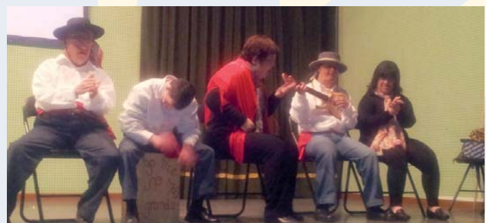
Obra de Teatro “Historias de una vida”

A veces, tal vez en demasiadas ocasiones, el expresar sentimientos, ideas, miedos o inquietudes se convierte en el mundo de la discapacidad en una tarea difícil. El teatro como medio de expresión se brinda como un instrumento eficaz. Clientes y clientas de la Unidad de Estancia Diurna con Terapia Ocupacional han podido comprobar la eficacia de este “arte”. “Historia de una vida” se ha convertido en una obra reveladora para todos y todas; con ella han podido trabajar, descubrir distintas técnicas teatrales y una vez más se puede comprobar que ellos y ellas son capaces. Muestra de ello son las distintas representaciones que se están llevando a cabo por toda nuestra comarca.