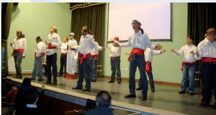
Celebración en PRODE del Día Internacional de las Personas con Discapacidad

Posteriormente, todos los centros tuvieron la ocasión de hacer diferentes representaciones teatrales y musicales. A continuación se hizo entrega de un reconocimiento al CAMF de Pozoblanco, por su 25 aniversario y el trabajo realizado durante este tiempo por las personas con discapacidad, finalizando la jornada con la entrega del galardón "Amigo de PRODE 2012" a la Rondalla y Coral de Ntra. Sra. de la Peña de Añora.