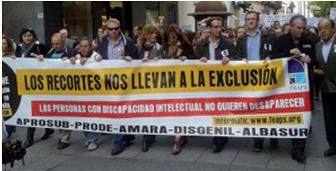
PRODE en la manifestación de Córdoba

Como consecuencia de la maltrecha situación económica que vive el sector de atención a la discapacidad, fundamentalmente por la demora en los pagos a los centros conveniados de atención especializada a las personas con discapacidad o en situación de dependencia, y la amenaza de recortar el precio público de estos servicios, se han desarrollado varios actos de reivindicación. Desde FEAPS Nacional se convocó una concentración el día 22 de noviembre en todas las provincias de España; asimismo, otra manifestación en Madrid organizada por el CERMI el 2 de diciembre y otra a instancias de FEAPS Andalucía para el 3 de diciembre en Sevilla. De destacar es la más que importante participación con que han contado todas estas movilizaciones.