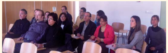
Curso de Introducción y manejo del Programa Sharepoint

Asimismo, en el mes de noviembre ha finalizado el curso de F.P.E. "Carpintero metálico y de PVC", de 1.170 horas de duración, en el que se han formado diez personas desempleadas.