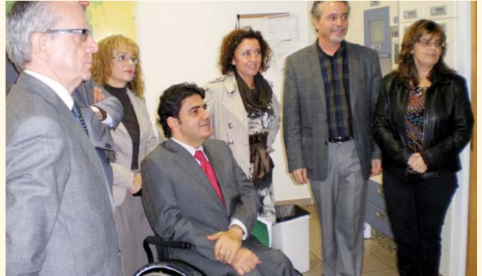
Visita de la Delegada de Salud y Bienestar Social y del Director General de Personas con Discapacidad

Seguidamente pasaron a visitar diferentes centros y servicios para conocer, in situ, el particular modelo de atención que desde PRODE se viene prestando para mejorar el día a día de cada uno de sus usuarios.