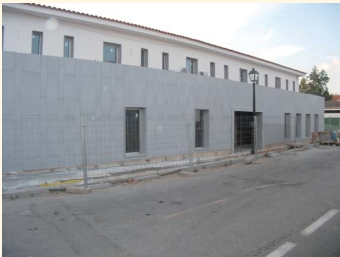
Hotel Rural de Hinojosa del Duque

Así, mediante el impulso de este proyecto, se permite la creación de oportunidades para el colectivo de las personas con discapacidad y, junto a los restantes proyectos apoyados por Adroches, se contribuirá a dinamizar la economía de la comarca.