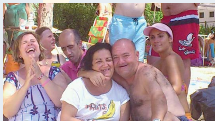
Residentes de PRODE en la playa de San Pedro del Pinatar

Transcurridos ya tres de los cuatro turnos de vacaciones de verano 2012 disfrutados en Conil de la Frontera, Aguadulce y San Pedro del Pinatar, el Servicio de Ocio de PRODE ha creado un programa para el verano con una agenda diversa, con el fin de que sus clientes puedan enriquecerse de experiencias y vivencias, todas ellas diseñadas desde el prisma de la inclusión social y la normalización. En dicha agenda podemos encontrar el disfrute de una jornada en el complejo turístico Isla del Zújar, la estancia de un fin de semana de aventura en un camping, la celebración de la gran fiesta del verano, así como la asistencia a las diferentes fiestas locales de los pueblos de nuestra comarca y eventos culturales y deportivos. Y como no podía ser de otra manera en verano, la piscina estará muy presente para combatir el calor de estos días y disfrutar del sol y del baño.