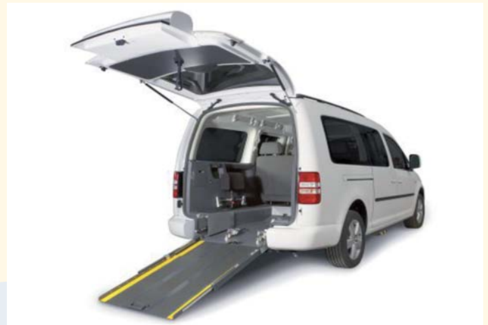
Tipo de vehículo adaptado

PRODE, una vez más, concurre en la convocatoria del Plan de Infraestructuras Regionales de la Fundación ONCE. La Entidad ha presentado este año un proyecto consistente en la adquisición de un vehículo adaptado para 9 personas, cuya funcionalidad será diversa y que facilitará la realización de numerosas actividades de la vida interna de la Organización. La adquisición de dicho vehículo será financiada, en caso de resultar elegido el proyecto, por la Fundación ONCE y por PRODE.