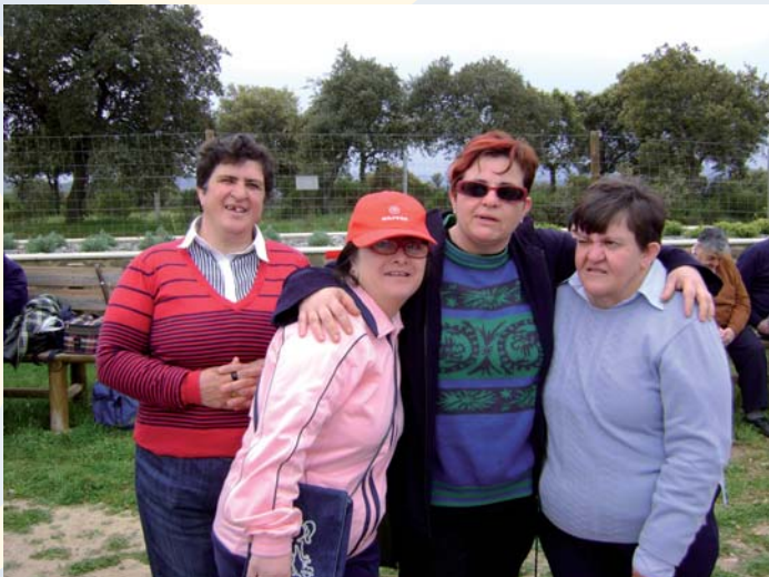
Usuarios y trabajadores de distintos centros disfrutando de un día de convivencia

Asimismo, el día de convivencia de la Entidad se celebró durante el pasado mes en el parque de San Martín (Añora). Durante este día trabajadores y usuarios pudieron disfrutar todos juntos de juegos, baile y otras muchas actividades.