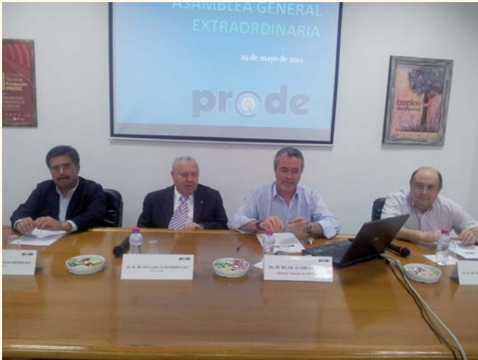
Asamblea General Extraordinaria