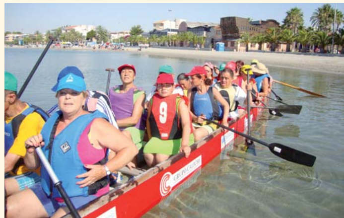
Vacaciones en San Pedro del Pinatar (Murcia)

Por otro lado, ha comenzado una nueva edición de la liga de fútbol-sala de FEAPS-Andalucía. PRODE participa en ella con un equipo que está entrenando desde hace varias semanas, junto con bastantes más compañeros debido al interés creado por las actividades deportivas. La competición consta de una primera fase provincial de ida y vuelta con cada rival, que se jugarán, a diferencia de otros años, en mayo y septiembre. Los ocho ganadores de las provincias andaluzas disputan una final que situará en el pódium al nuevo campeón andaluz.