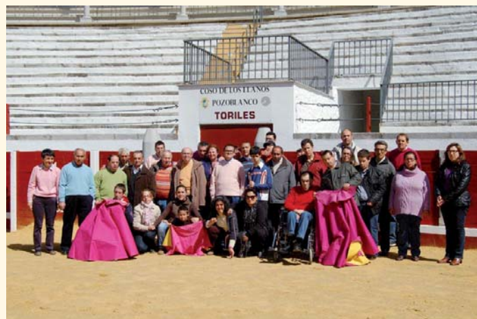
Usuarios de distintos centros de PRODE en el Coso de Los Llanos

Durante la Semana Santa también PRODE ha desarrollado salidas cada día para disfrutar de las procesiones de las diferentes cofradías de la zona. Algunos clientes han querido participar de una manera más activa en las procesiones, saliendo como nazarenos en algunas de ellas.