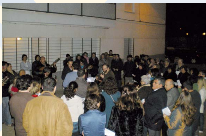
Trabajadores de PRODE cantando la Pasión en VVTT

De esta manera la Entidad pone su granito de arena en la conservación de estas serenatas tradicionales donde los trabajadores y amigos de la Organización participan llevando esta tradición a los distintos centros y domicilios de amigos.