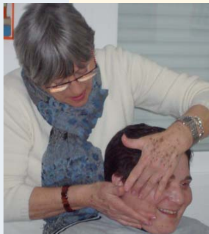
Voluntaria de PRODE enseñando a maquillarse

Porque yo lo valgo es un taller dirigido a las usuarias de PRODE, impartido por una persona voluntaria de la Entidad. La apariencia externa es algo que debe cuidarse a diario, por lo que este taller pretende dar las pautas necesarias para saber arreglarse. Es importante sentirse guapa y sacar lo mejor de cada una.