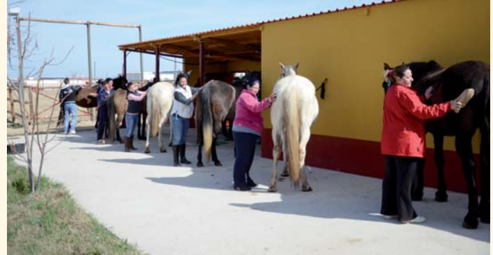
Curso "Auxiliar de Turismo Ecuestre"

Por otra parte, se han iniciado también dos acciones de Formación Profesional para el Empleo del Servicio Andaluz de Empleo: "Auxiliar de turismo ecuestre", en el que se formarán durante cuatro meses un total de diez personas y "Atención sociosanitaria a personas en el domicilio", en el que se formarán también diez personas durante cinco meses.