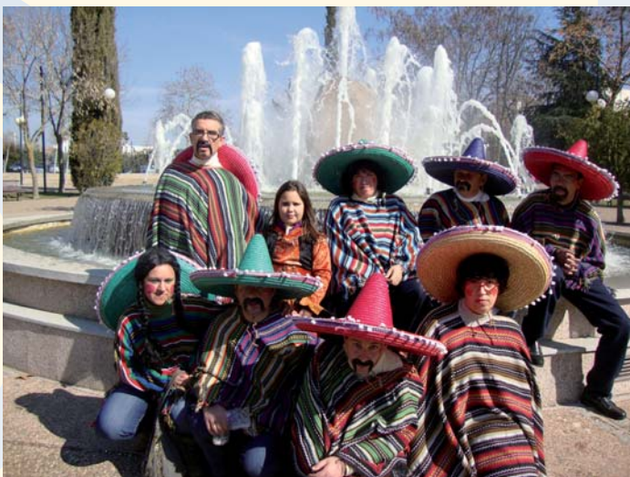
Usuarios de PRODE en el Carnaval de Pozoblanco

Durante el mes de febrero, han sido varias las actividades de ocio que se han llevado a cabo con el fin de hacer partícipes a los clientes de PRODE de actividades y eventos normalizados y contextualizados en la comunidad. La romería de la Virgen de Luna se vivió de manera activa, desplazándose un amplio número de clientes al santuario para disfrutar de este día de celebración para Pozoblanco. Y a finales de mes, el Domingo de Piñata, clientes de los distintos servicios se disfrazaron de mejicanos y salieron a las calles de Pozoblanco para divertirse y participar de la fiesta del Carnaval.