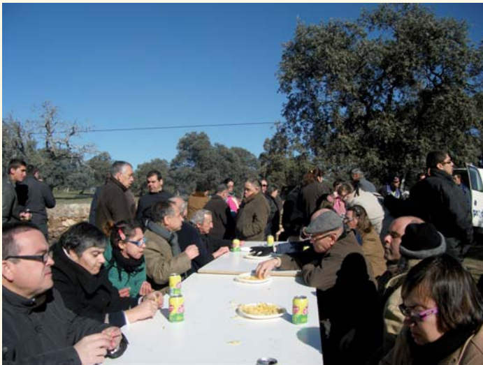
Usuarios de PRODE en la Romería de la Virgen de Luna

Durante el mes de febrero, han sido varias las actividades de ocio que se han llevado a cabo con el fin de hacer partícipes a los clientes de PRODE de actividades y eventos normalizados y contextualizados en la comunidad. La romería de la Virgen de Luna se vivió de manera activa, desplazándose un amplio número de clientes al santuario para disfrutar de este día de celebración para Pozoblanco. Y a finales de mes, el Domingo de Piñata, clientes de los distintos servicios se disfrazaron de mejicanos y salieron a las calles de Pozoblanco para divertirse y participar de la fiesta del Carnaval.