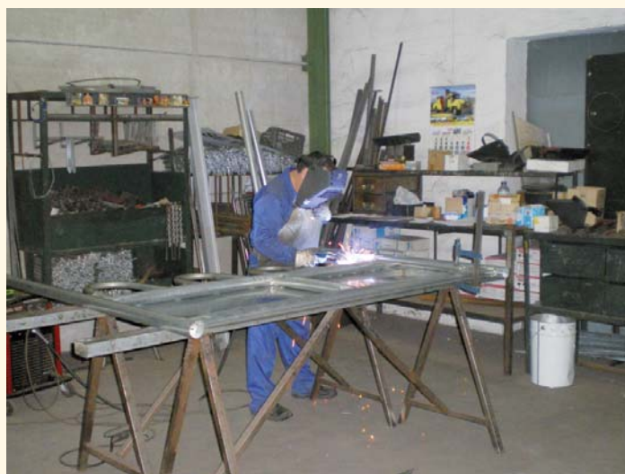
Taller del Curso de Carpintería Metálica

Serán en total treinta las personas a formar en las especialidades de Atención sociosanitaria a personas en el domicilio, Auxiliar de turismo ecuestre y Carpintero metálico y de PVC, impartándose más de dos mil horas de formación a lo largo del ejercicio 2012.