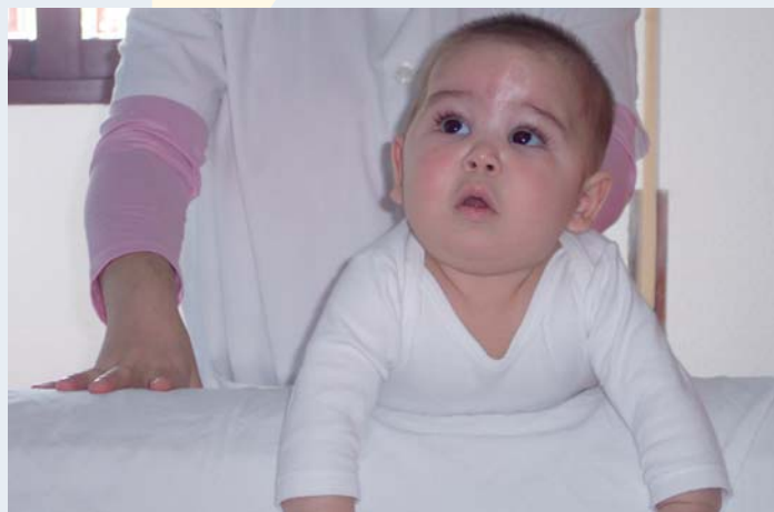
Sesión a usuario de Atención Temprana

La iniciativa, pionera en Andalucía, está siendo valorada de forma muy positiva por las familias y supone, para los profesionales de los CAIT, una herramienta muy eficaz en su trabajo.