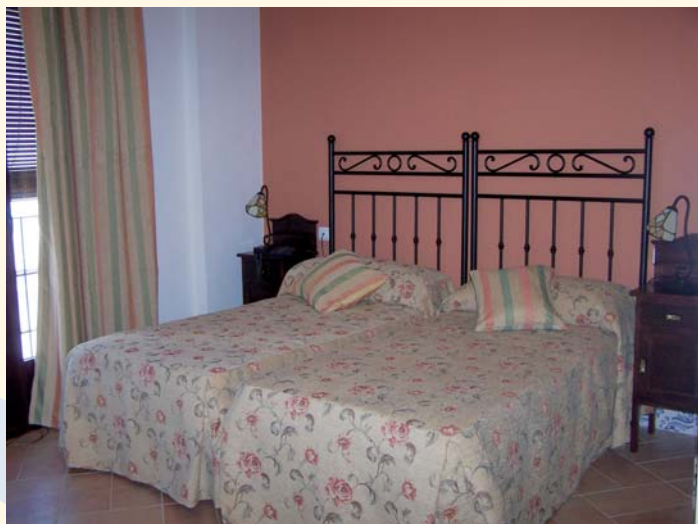
Habitación del Hotel Rural Casas de Don Adame

Este mes de enero se cumplen seis meses desde que el Hotel Rural Casas de Don Adame abrió sus puertas de la mano de PRODE, naciendo así el grupo Egaru Hoteles. Ha sido un periodo intenso, con momentos memorables como las Fiestas de Santa Ana, la Virgen de Agosto o Navidad, en los que decenas de personas han podido disfrutar de la propuesta gastronómica que el establecimiento les ofrece y se han podido alojar en sus acogedoras habitaciones, decoradas al gusto de la tierra. Y es precisamente en este momento cuando Casas de Don Adame pone en marcha una serie de paquetes de turismo activo, basados en la gastronomía ibérica, las fiestas y tradiciones, el bienestar personal y los deportes, que pretenden enriquecer la experiencia de alojamiento y ofrecer un producto de alta calidad. Por otro lado, próximamente estará lista la web del Grupo Egaru Hoteles ( www.egaruhoteles.com ), en la que se podrá estar al tanto de las nuevas propuestas y novedades.