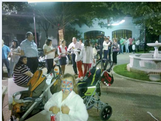
Fiesta fin de curso

Durante este curso, se han beneficiado en torno a cien menores y sus familias, y las perspectivas son de crecimiento en el próximo ejercicio. En cualquier caso, ahora es momento de descanso y de tomar fuerzas para el próximo curso.