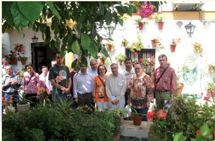
Grupo de usuarios en un patio cordobés

Por otra parte, y como viene siendo habitual todos los años por estas fechas, se realizó un día de convivencia de todos los servicios de la Entidad, en el parque de San Martín de Añora, donde usuarios y trabajadores pasaron un día de convivencia.