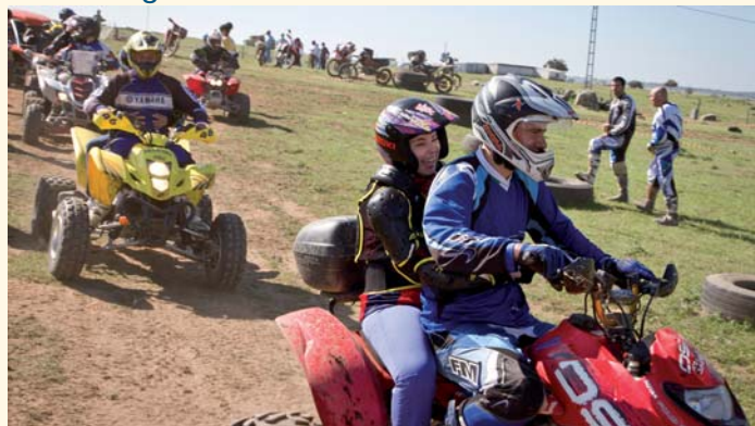
Grupo de usuarios disfrutando con la Asociación Deportivo Motera DELSUELONOPASO de un día en los quads

Días después, integrantes de la asociación motera visitaron a los usuarios de PRODE en sus centros, conociendo las instalaciones de esta Entidad de manos de sus compañeros de ruta y disfrutando de un día entre amigos.