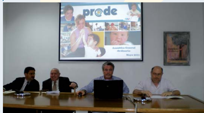
Asamblea General Ordinaria de PRODE

Como proyectos de inversión para este año están la finalización de la construcción de las Unidades de Día de Mayores de Dos Torres e Hinojosa del Duque, así como el hotel rural de Hinojosa del Duque. Y, sin duda, un proyecto que será vital para la entidad será la elaboración durante este año del III Plan Estratégico 2012-2015, el cual establecerá las líneas fundamentales de actuación de la entidad en su gestión para los próximos cuatro años.