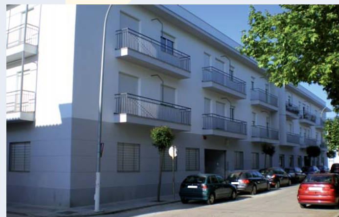
Nuevas Viviendas Tuteladas y ampliación Unidad de Mayores

En referencia a las viviendas tuteladas, se trata de ofrecer a 32 personas con discapacidad intelectual la posibilidad de vivir en un régimen residencial lo más normalizado posible. Respecto a la ampliación de la Unidad de Estancia Diurna para Personas Mayores, la cual está próxima a completarse, se trata de ofrecer 40 plazas más a aquellas personas que puedan necesitar, por cualquier motivo (demencia senil, alzheimer, etc.), un servicio especializado.