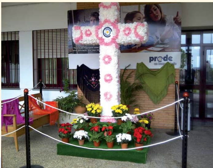
Cruz realizada por usuarios de las Viviendas Tuteladas

En esta edición y como en las anteriores, la cruz se expuso en la entrada principal de la Entidad, donde los trabajadores y usuarios del Servicio de Viviendas Tuteladas han sido los encargados de su organización y elaboración, con un diseño floral muy original y de mucho colorido. Todo ello, realizado con los materiales esenciales: papel, cola y dedicación.