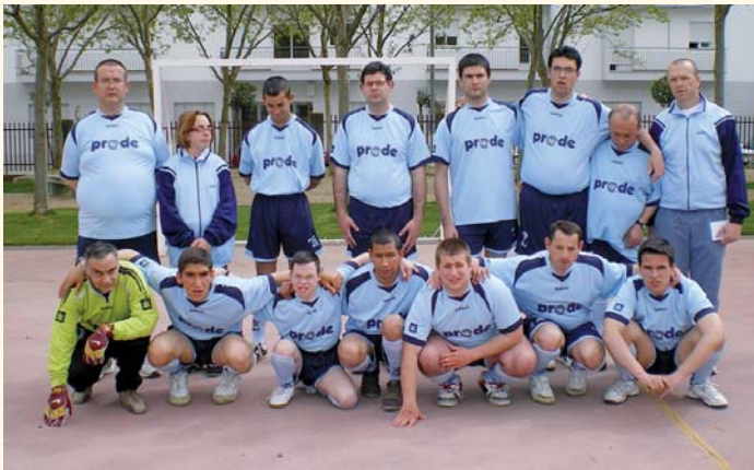
Equipo de Fútbol Sala PRODE 2011

Un año más, comienza una nueva edición de la ya consagrada Liga de Fútbol Sala de FEAPS-Andalucía en la que participará el equipo de PRODE. Esta competición se divide en una primera fase provincial, en la que todos los equipos de Córdoba disputarán una liguilla donde se irán midiendo, a doble partido, al resto de adversarios. Los ocho ganadores de las diferentes provincias de Andalucía disputarán una fase final que coronará al nuevo campeón andaluz, como prestigioso vencedor de una liga que, año a año, va adquiriendo más solera y nivel deportivo. Los integrantes del equipo de esta Entidad ya pasaron la pertinente revisión médica y siguen entrenando duro para mejorar los resultados conseguidos en los años precedentes.