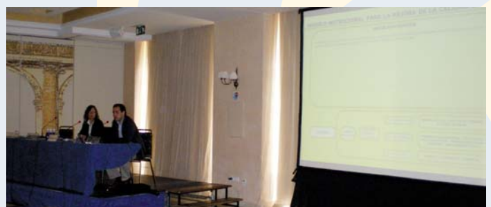
Congreso de dietistas-nutricionistas en Toledo

El comité científico del encuentro se mostró muy interesado en el proyecto y animó a desarrollar iniciativas como ésta, en la que la alimentación se muestra como componente de la felicidad necesaria para tener una buena calidad de vida.