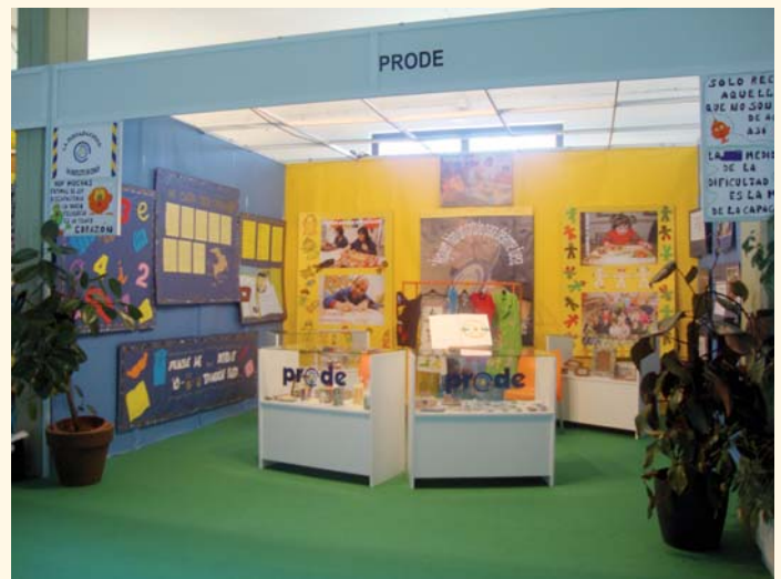
Stand de PRODE en el Salón del Libro

Como ya es habitual, PRODE ha participado en este evento con un stand elaborado por las diferentes unidades de estancia diurna de la Entidad y enfocado igualmente al binomio lectura-diversidad. Pero en esta edición, además, dentro de la programación del Salón, clientes del Servicio de estancia diurna con terapia ocupacional han representado la obra teatral “Rayito”, obteniendo, al igual que en representaciones anteriores, un notable reconocimiento.