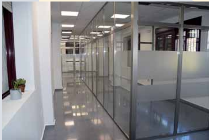
Vista de la ampliación del Área de administración

Cada día son más las iniciativas que van desarrollándose para el cumplimiento de la misión de PRODE. Es consecuencia de esa realidad la ampliación de las instalaciones que acogen el Área de administración ubicada en la sede central. En estas nuevas oficinas quedará instalado el Departamento de capital humano, la Dirección general adjunta y la Dirección del departamento de comunicación, además de la disposición de un espacio común para reuniones.