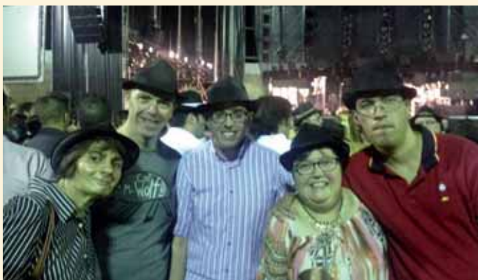
En el concierto de El Barrio

Este mes de agosto varios grupos de usuarios han querido ir de conciertos y ferias. Unos se han trasladado a Herrera del Duque (Badajoz), para ver el concierto de "El Barrio"; muy animados con sus sombreros se convirtieron en unos "barrieros" más. Otros en Villanueva de Córdoba en el concierto de "La Guardia". Dicen que la música alegra los corazones, y los de ellos estaban a reborar y aún les quedaron ganas de irse de feria a Dos Torres y pasar la noche bailando; mucha marcha que hay en esos cuerpos.