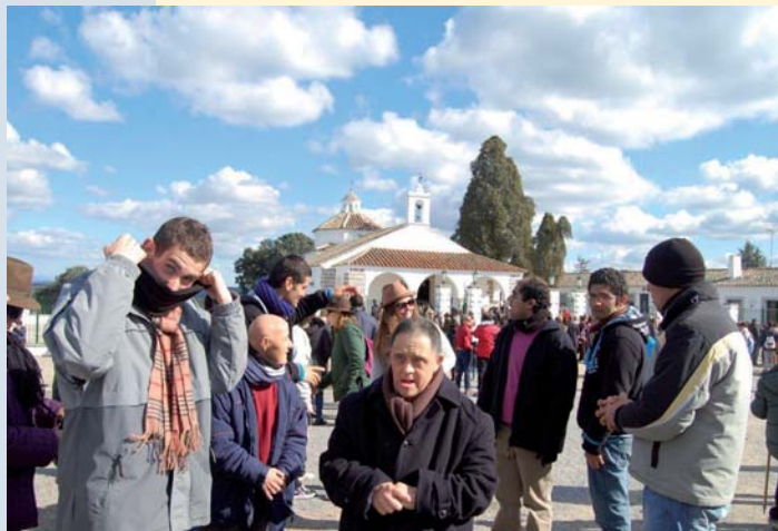
Varios usuarios en el Santuario

El 31 de enero se celebró una gran fiesta para Pozoblanco, en una magnífica jornada: la romería de la Virgen de Luna. Casi la totalidad de los clientes residenciales de PRODE asistieron a la misma en el Santuario. Alrededor de 150 usuarios que disfrutaron por todo lo alto del ambiente, de las tradiciones, de la comida, del tirar de la campana y cómo no, de la Virgen de Luna.