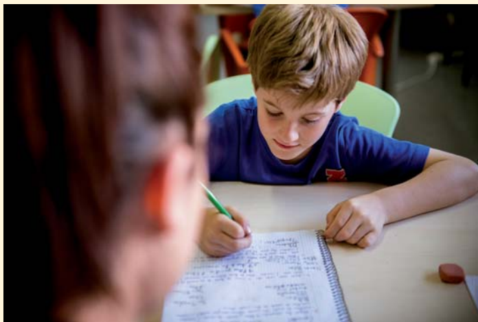
Comienza el curso 2015-2016

El trabajo se realiza desde una perspectiva global, interviniendo con el menor, con su familia y en los entornos naturales, con el objetivo último de conseguir resultados personales significativos.