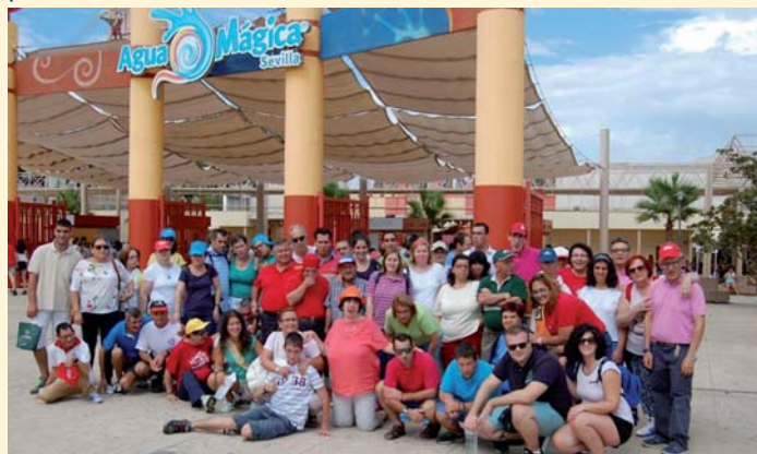
Culminando el verano en Isla Mágica

Muchas son las actividades que realizan los clientes de PRODE, especialmente en la época estival por la gran oferta de eventos que organizan nuestros pueblos, pero podemos decir que este año ha destacado una por la diversión y gran emoción que ha despertado en ellos. Y es que, como colofón para clausurar el verano, PRODE viajó a Sevilla al parque temático de Isla Mágica. En la actividad participaron un total de 45 clientes que pasaron una jornada inolvidable que les hizo vivir una gran aventura entre atracciones, paseos en barco, espectáculos y piratas.