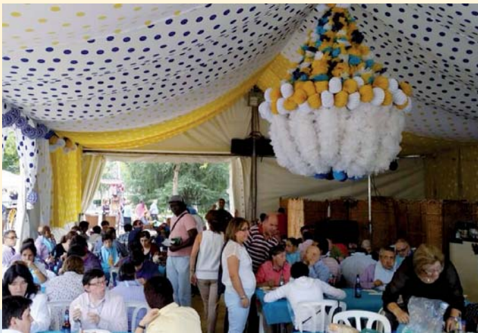
Ambiente en la Caseta de PRODE Feria Pozoblanco 2014

En sus ya más de veinte años de caseta, PRODE la ha compartido con toda la población en general, siendo un espacio de convivencia, diversidad y normalización donde divertirse: las puertas están abiertas.