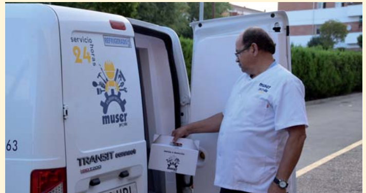
MUSER PRODE realiza el reparto de la Red de Solidaridad y Garantía Alimentaria de Andalucía

En el marco de la Red de Solidaridad y Garantía Alimentaria de Andalucía, PRODE ya ha recibido la resolución de la Delegación Territorial de Igualdad, Salud y Políticas Sociales de Córdoba, para preparar y repartir alimentos a personas con escasos recursos económicos y/o en riesgo o situación de exclusión social, a través de un servicio de catering a domicilio. En concreto, PRODE hará este reparto, de más de 6.000 menús, a 34 municipios de las zonas de trabajo social de Doña Mencía, Hinojosa del Duque, Peñarroya-Pueblonuevo, Pozoblanco y Villaviciosa de Córdoba.