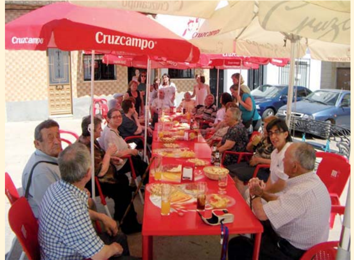
Convivencia en las fiestas de Santa Eufemia

El Servicio de ayuda a domicilio (SAD) de PRODE, dentro de su programación anual, tiene diversas acciones o actividades encaminadas a potenciar el ocio de sus clientes, y así, su calidad de vida. Una de estas actividades, llamada "Mayores con ilusiones", se ha desarrollado en Santa Eufemia en las vísperas de la feria y fiestas de San Pedro, participando un total de 29 personas entre usuarios, familiares y profesionales, organizando un encuentro en la plaza del pueblo disfrutando del ambiente festivo. Por otro lado, los usuarios del SAD de El Viso, por las fiestas de Santa Ana, no fueron menos, organizándose un día de convivencia que culminó con un paseo en tren y la degustación de unos aperitivos en el Hotel Rural Casas de Don Adame.