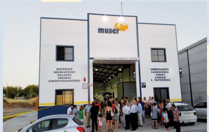
Momento de la inauguración de MUSER Auto

PRODE inauguró el 10 de julio en Pozoblanco MUSER Auto, un taller de reparación y mantenimiento de vehículos así como un lavadero de coches. Se trata de una idea de negocio que, por un lado, cubre una necesidad de la Entidad y, por otro, supone una oportunidad para generar empleo para personas con discapacidad, habiéndose creado seis puestos de trabajo. En el acto inaugural, el presidente de PRODE hizo hincapié en la necesidad de impulsar el emprendimiento social y expuso los proyectos innovadores en los que la Organización está inmersa, recordando la responsabilidad de la Entidad en proporcionar calidad de vida a sus clientes.