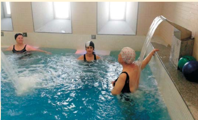
La Unidad de Hinojosa presta servicios de hidroterapia para mayores

La Unidad de estancia diurna para personas mayores "El Carmen" de Hinojosa del Duque continúa consolidando su programa de servicios. Las actividades terapéuticas programadas y de rehabilitación física y cognitiva están consiguiendo una amplia participación de personas mayores, tanto hinojoseñas como de municipios cercanos, gracias al servicio de transporte adaptado que ofrece. Asimismo, durante la feria de San Agustín de Hinojosa, la unidad amplía sus servicios poniendo a disposición un programa de respiro familiar. Todo ello está siendo posible gracias a la flexibilidad y a la adaptación a las necesidades de los clientes, en estrecha colaboración con las entidades sociales del municipio.