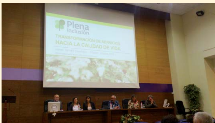
Una de las reuniones mantenidas dentro del Servicio de Atención temprana