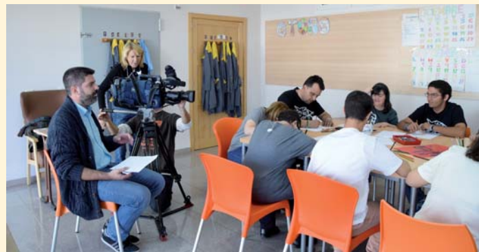
Equipo del programa de televisión "Solidarios" grabando en PRODE

El programa de televisión "Solidarios" de Andalucía Televisión (ATV) emitió el pasado 30 de octubre un reportaje sobre Yosíquesé como ejemplo de iniciativa empresarial generadora de inclusión, a través del diseño y la creatividad de las personas con discapacidad intelectual. El programa permitió conocer de primera mano cómo funciona el proceso creativo de Yosíquesé, desde la concepción de los productos hasta su comercialización.